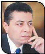
بقلم: جوزيف عزت

أشياء سادت شوارع مصر.. اشتباكات مشاحيات اعتصامات اختلافات.. مشاجرات.. تظاهرات مؤيدة ومعارضة استخدمت فيها كل أنواع الأسلحة من اتهامات ونخبوس وتكفير وتهديد.. لا أحد ينظر إلى مصلحة مصر.. الاقتصاد وما وصل إليه.. لا أحد يدرك أننا نتراجع ولا نتقدم في وقت نحن أحوج فيه إلى العمل والإنتاج والاستقرار والالتقاء على كله سواء من أجل التوحيد ولم شمل مصر بدلاً من التفكك والانقسام السائد.. فماداً ينتج من هذه المهزلة والفضوى واستفراط هيبة وكيان الدولة وبمزق الأمة وفتيتها والسيبر في نفق مظلم ومصير مجهول. الانقسام يهدم في مصر.. يخرّب مصر.. يقتل مصر