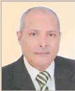
بقلم: أ محمد عبدالفضيل مدير عام مساعد التحقيقات

الأفضل في نوبح الجزاء هو إجراء تحقيق كتابي كضمانة لسلامة التحقيق إعمالا للقانون رقم ٤٧، ٤٨ لسنة ١٩٧٨ ولأن يتم بمعرفة الجهة المعنية بإجراء التحقيق - إلا أن المشرع أجاز في صلب المادة ٧٩ من القانون رقم ٤٧ لسنة ١٩٧٨ على سبيل الاستثناء أنه يجوز للرئيس المباشر توقيف جزائي الانذار والنصم من الرتب لمدة لا تزيد عن ثلاثة أيام بعد إجراء التحقيق شفاهه مع الموظف شريطة أن يثبت في القرار مضمونه ومحتواه وهو ما أكدته المادة ٦ من لائحة الجزاءات والمادة ١٠٤ من لائحة شئون العاملين المعمول بها بالشركة ويهدف المشرع من ذلك سرعة الفصل في الموضوع وعدم تعطيل للرفق التابع له وهذا الاستثناء لا يجوز القياس عليه أو التوسع فيه لاعتبارات احتضتها حالة الضرورة.