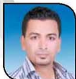
بقلم: محمد طه

فعلينا أن نواجه هذا المخطط الذي بث الفتن باندراء الأديان وبتناسق بلا تفكير وراء هذا الفكر الذي لا يقبله أي مصري أصبل أبداً.. بالعمل وعودة دوران عجلة الإنتاج لتعويض ما فاتنا.. وعلياً أيضاً أن نفكر ونسأل أنفسنا سؤالاً محمداً ماذا جئنا من وراء الكلام عن الفتن وهدم الدولة - الإجابة بالطبع لا شئ نسوى أننا ننفذ المخطط وبلا تفكير وضياع البلاد ودخولنا في أزمان اقتصادية لا خروج منها سوى بالعمل وبنتهي الجدية ونستعيد لفتنا في بعضنا البعض وكفانا نخوبنا وتكفيراً.. فمصر الآن تنادى كل أبنائها للتوحيد والعمل فقط لتثبيت للعالم أن مصر صاحبة أقدم حضارة في التاريخ مصر التي علمت العالم وانبهر بها العالم.. مصر العظيمة بأبنائها.. لكي الله يا مصرنا.