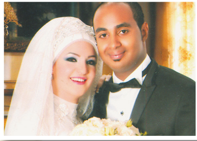
أحمد نبيل الزميل / عادل إمام - القاسم الآلي